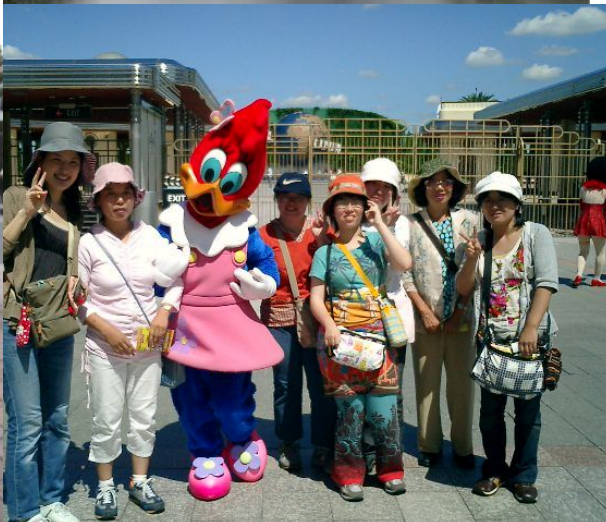
2005年 9月 8-9日大阪旅行 左:海遊館 右:USJ