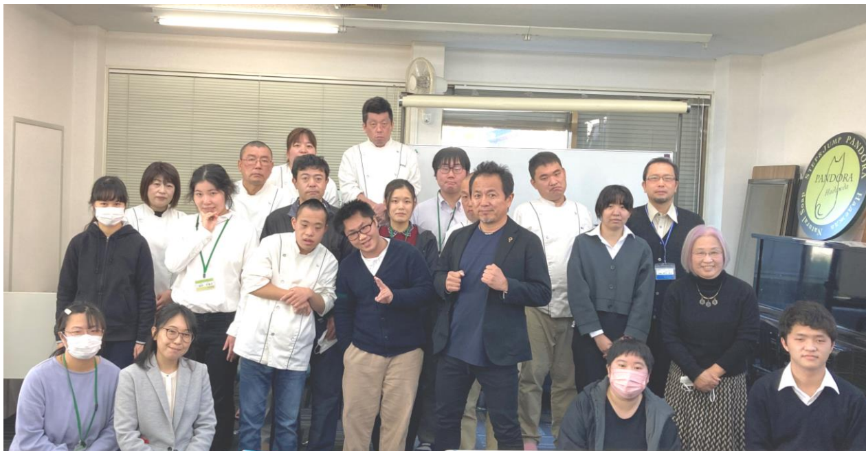
2022年1月5日 年賀式にて