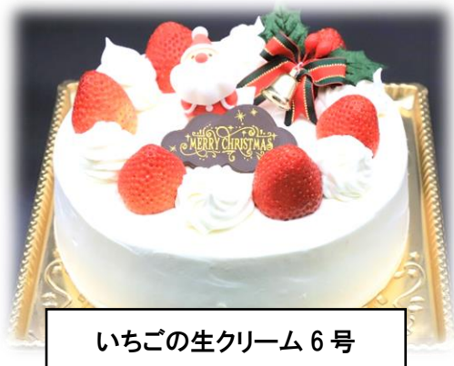
いちごの生クリーム6号