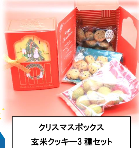
クリスマスボックス 玄米クッキー3種セット